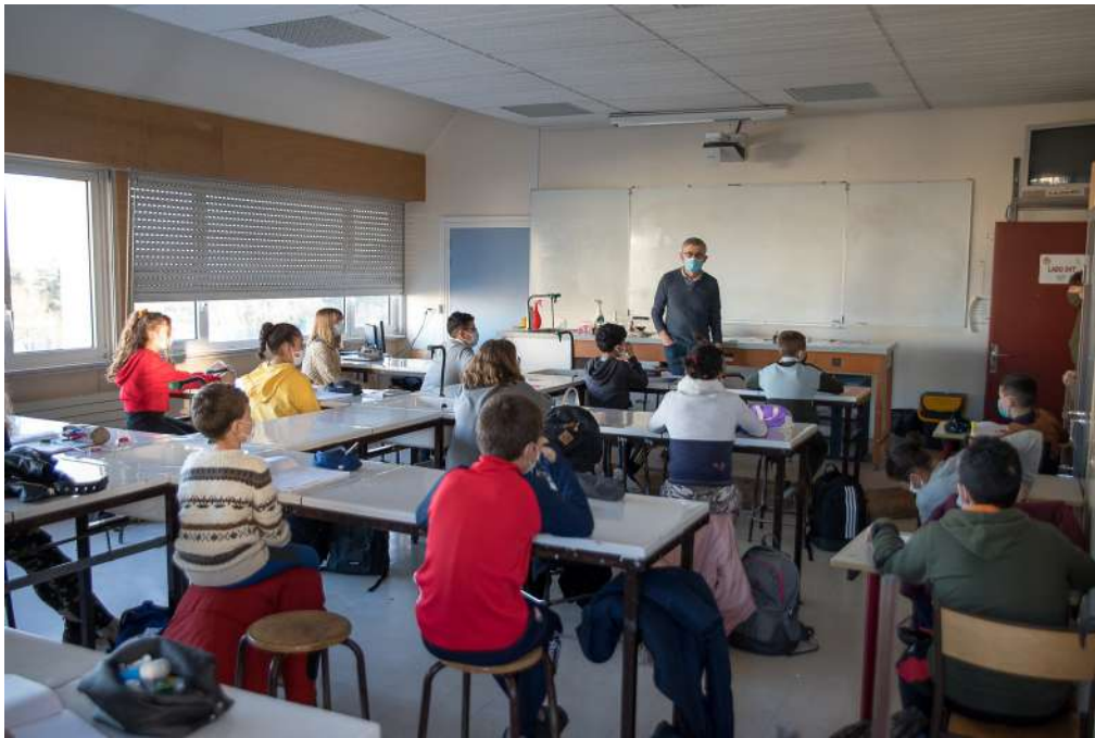
La salle de SVT