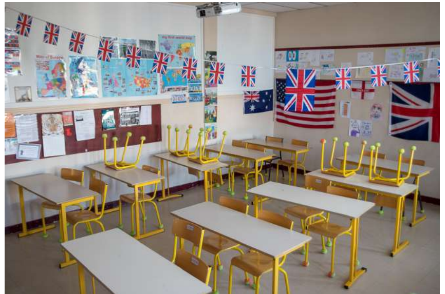
La salle d'anglais