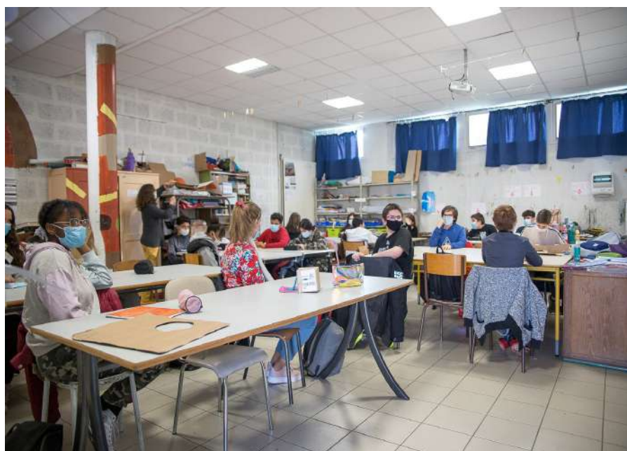
La salle d'Arts Plastiques