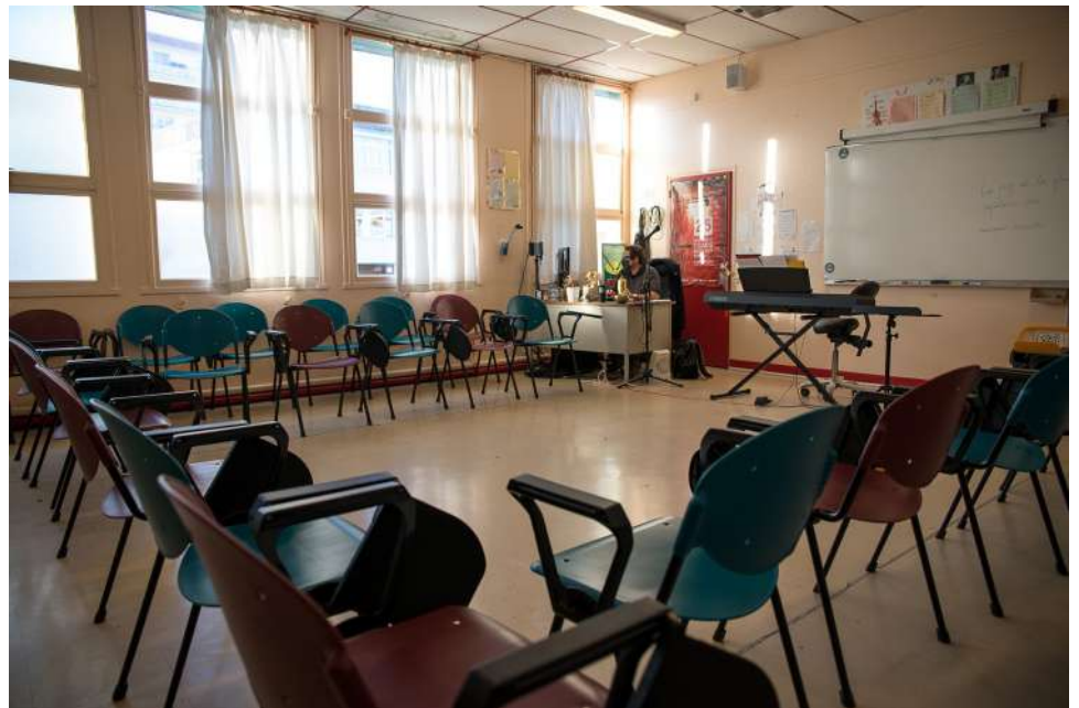
La salle d'Education Musicale