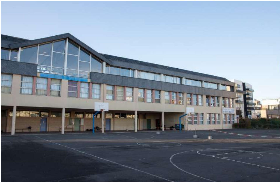
La cour de récréation