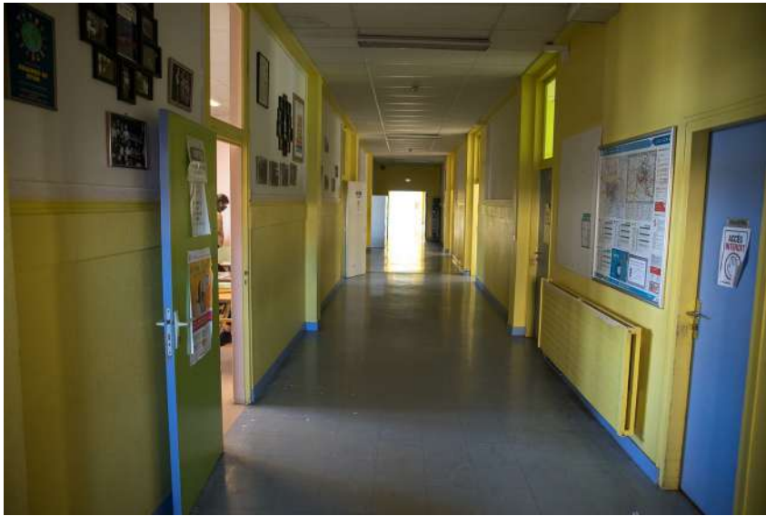
Le couloir du premier étage